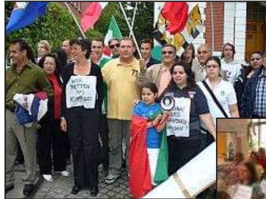
Maniñestantes frente al Consulado de Amburgo.

deterioradas en los últimos tiempos. Esta gestión parlamentaria ha permitido verificar que cuando sobre las tendencias prevalece la voluntad de tutelar y promover los intereses reales de nuestras comunidades, se pueden obtener resultados concretos, no obstante las dificultades financieras que se están atravesando. A lo largo de nuestro país existen 13 Oficinas Consulares regionales (ver recuadro), que esperamos sinceramente no se vean afectadas por esta reestructuración. 4