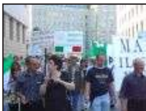
Manifestantes en Nuremberg.

El cierre de los consulados no es la forma más adecuada de reducir costos y las consecuencias son muy serias. No solamente afectaría a las comunidades italianas en el exterior, que tendrían que viajar cientos de kilómetros hasta la oficina consular más cercana para realizar sus trámites, sino también afectaría los intereses del propio Estado Italiano en política comercial, cultural y otras.