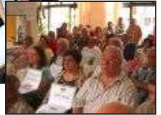
Reunión de protesta en Mannheim.