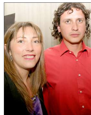
Jóvenes profesionales socios de SIRECI.