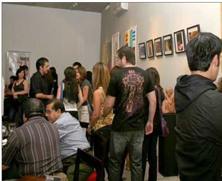
Un sector de la muestra y la animada asistencia de público.